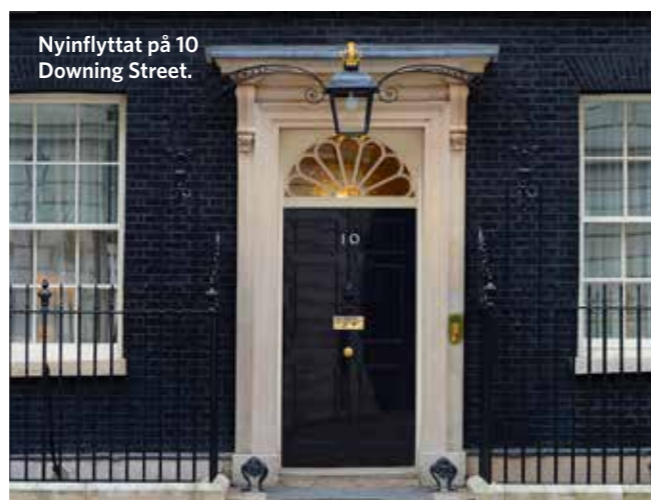
Nyinflyttat på 10 Downing Street.

Produktion Kung & Partners Tryck Åtta.45, Solna