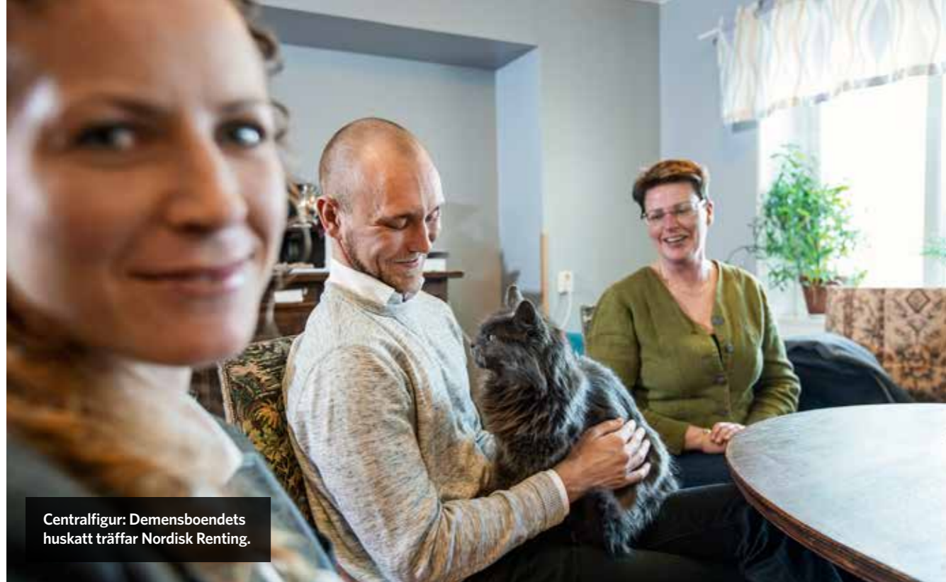
Centralfigur: Demensboendets huskatt träffar Nordisk Renting.