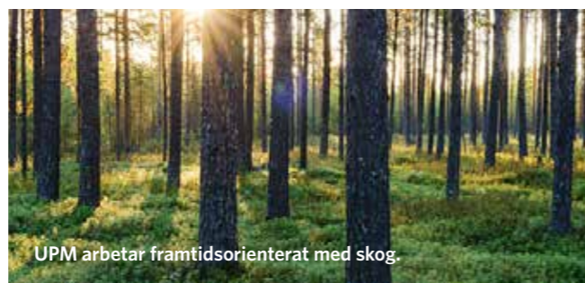
UPM arbetar framtidsorienterat med skog.

Det skotska nationalistpartiet SNP hade stora framgångar i valet och osäkerhet råder om Skottland kommer att kräva en ny folkomröstning om självständighet. RBS bedömer att den frågan aktualiseras först vid ett eventuellt ja till ett brittiskt utträde ur EU.