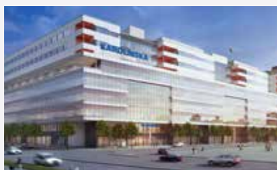
ILLUSTRATION: WHITE TENGBOOM TEAM

GRUNDTANKEN I DET pågående utvecklingsprojektet för Stockholms hälso- och sjukvård är att alla ska vårdas på rätt vårdnivå, för patientens bästa och för att vården ska vara kostnadseffektiv. Dessutom växer Stockholmsregionen.